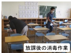
放課後の消毒作業