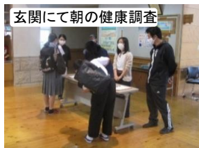
玄関にて朝の健康調査