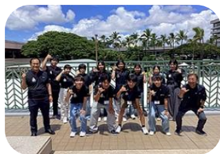
←1日目 英語での入国審査を 無事にクリアし、 ホノルルに到着！ 3日目→ 戦艦ミズーリ号を見学