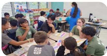
↑4日目 ↓5日目 アヌエヌエ学園との交流

留学生たちは、ホームステイやアヌエヌエ学園との交流、第二次世界大戦の終結となる降伏文書調印式が行われた戦艦ミズーリ号や太平洋航空博物館での平和学習などを体験して、今の自分を見つめ今後の生き方を考える機会となりました。