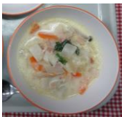
かぶのポタージュ