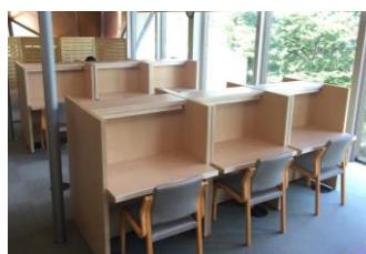
学習席も新設され、集中して学習に取り組めます。