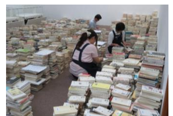
休館期間中に、本の除籍作業も行いました。