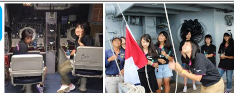
世界初！中学生が戦艦ミズーリ号に宿泊