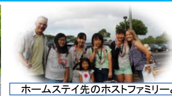
ホームステイ先のホストファミリーと