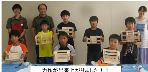
力作が出来上がりました！！

8月17日、宇佐市民図書館で、スライド本立て作り教室を開催し、市内の小学校5・6年生8名が参加しました。