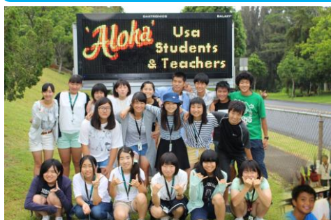
ミラニ中学校に体験入学