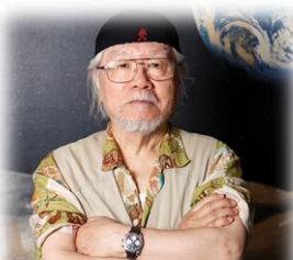
松本 零士 先生