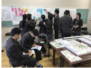
▲各自の意見を発表する様子