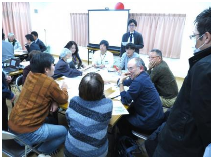
▲班別に意見交換を行う様子