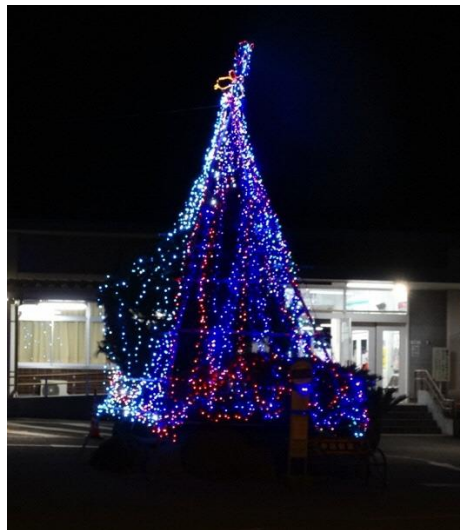
▲柳ヶ浦駅前のイルミネーション

同会議のまちづくり活動の一環で取組まれており、寒空の下、地域の方々や駅利用者など多くの人の心を温めています。皆さんも是非一度ご鑑賞ください。