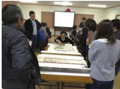
▲模型を囲んで説明を受ける様子

意見交換では、様々な観点のご意見をいただき、各班とも大変参考になる意見発表でした。