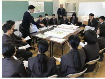
▲計画案の説明を聞く様子

模型を使って新デザイン案を確認しながら、「今の駅周辺の不満点・新デザイン案の良い点・悪い点」などについて意見交換を行いました。使い心地はもちろん、希望や楽しいアイデアなど、活発かつ高校生ならではの意見をいただくことができました。