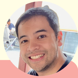
お便りをくれた方

今まで10か国以上訪ねた中で、私は日本が一番好きです。これからも日本で働き続けたいと思っています。