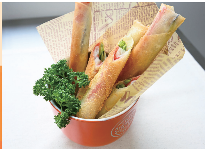
レシピ引用：キューピー(株)「子どもの心をくすぐる野菜のレシピ」