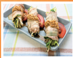
豆苗ともやしの豚肉巻き (市ホームページで紹介)

高齢になると栄養が偏り、たんぱく質不足となって筋肉が落ちる場合があります。身体活動が思うようにできず、転倒から思わぬ骨折の恐れもあるため、筋肉を落とさない食事が大切です。たんぱく質を多く含む肉や魚、卵や大豆製品を小まめに取りましょう。