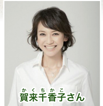
かきこ 千香子さん 賀来千香子さん

疎水事業の父と呼ばれる郷土の偉人・南一郎平が没後100年を迎えるとともに、生涯を捧げ完成させた広瀬井路が通水150年となります。この功績を称え記念式典を開催します。 ※来賓に女優の賀来千香子さんをお迎えします。