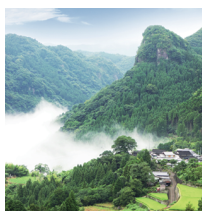
宇佐のマチュピチュ