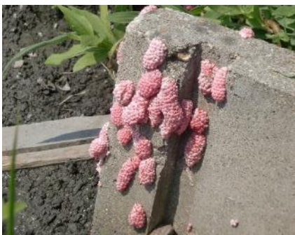
用水路（水口）の卵塊