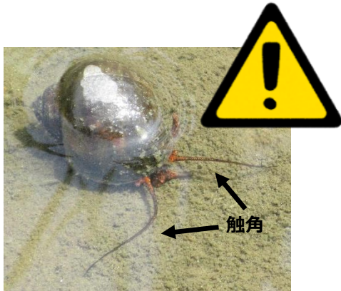
ジャンボタニシ（スクミリンゴガイ）