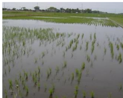
移植直後に食害を受けた移植苗