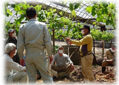
ぶどう部会講習会の様子