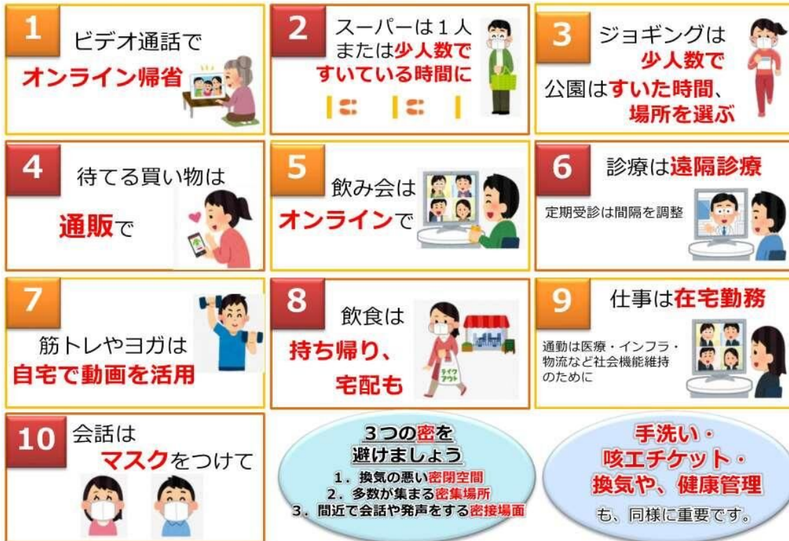
図1 人との接触を8割減らす、10のポイント（厚生労働省のウェブサイトより一部抜粋）

緊急事態宣言の中、誰もが感染するリスク、誰でも感染させるリスクがあります。 新型コロナウイルス感染症から、あなたと身近な人の命を守るよう、日常生活を見直してみましょう。