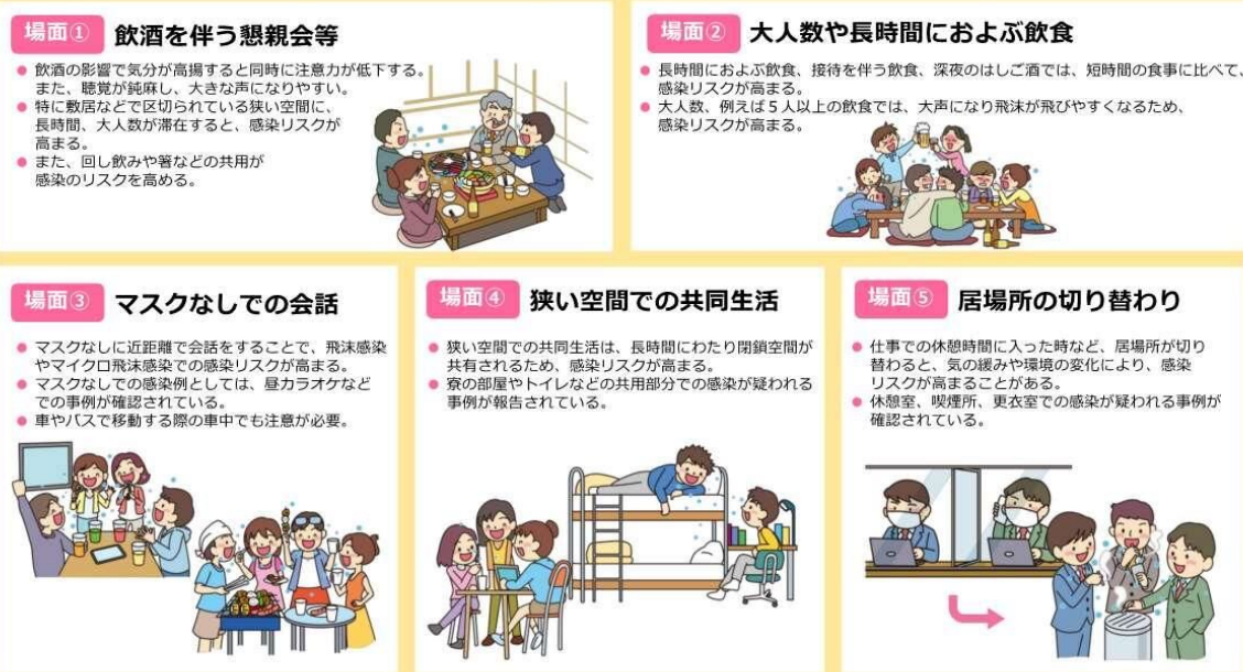
図2 感染リスクが高まる「5つの場面」（内閣官房のウェブサイトより一部抜粋）