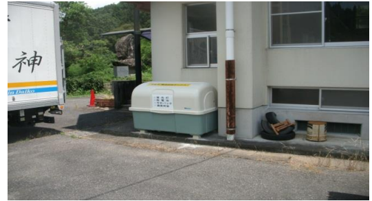
④ 高並校区 (高並体育館)