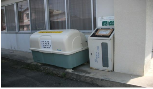
① 南院内校区 (南院内地区公民館)