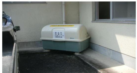
② 院内校区 (院内地区コミュニティセンター)