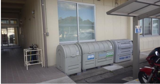
③ 東院内校区 (院内支所)