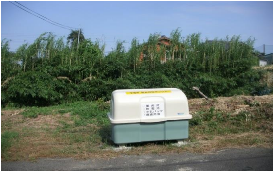
① 封戸校区 (荻宇田団地前)