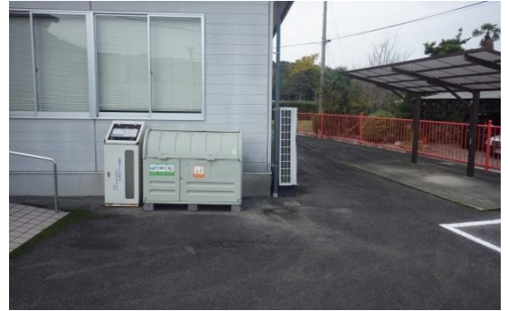
② 北馬城校区 (旧宇佐出張所)