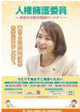
人権擁護委員のポスター

人権擁護委員法が1949(昭和24)年6月1日に施行されたことを記念して、毎年6月1日を「人権擁護委員の日」と定め、全国各地で特設相談所を開設し、人権に関する相談に応じたり、啓発活動を実施しています。