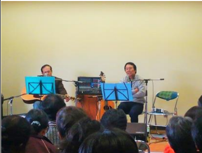
ヒューマンバンド「熱と光」

12月5日(土)に「隣保館ふれあい広場」を開催し、午後から北九州市在住のヒューマンバンド「熱と光」の記念講演がありました。ふれあい広場は1日を通して360名ほどの参加があり、記念講演も多くの方々が残ってくれました。今号では、その感想を紹介し、また、ふれあい広場の詳細については次号で報告します。