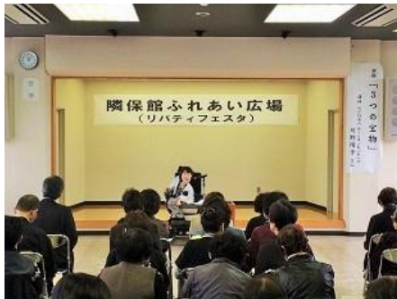
昨年度の記念講演の様子

今年度の「隣保館ふれあい広場（リバティフェスタ）」の日程が、7月16日の実行委員会で下記のとおり決定しました。内容の詳細については、今後の実行委員会で話し合っていく、10月25日号の隣保館だよりで、お知らせしたいと思います。バザー等の参加について希望等がありましたら、当隣保館（0978-33-1707）までお問い合わせください。人権についてわかりやすく、楽しみながら考える一日にしたいと思っています。多くのご参加をお願いします。