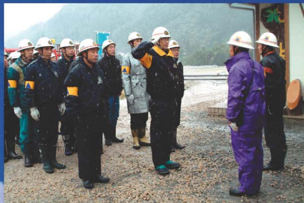
写真：鳥取県国民保護訓練で活動する三朝町消防団員