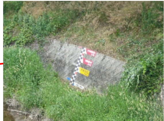
伊呂波橋(水位計設置箇所)