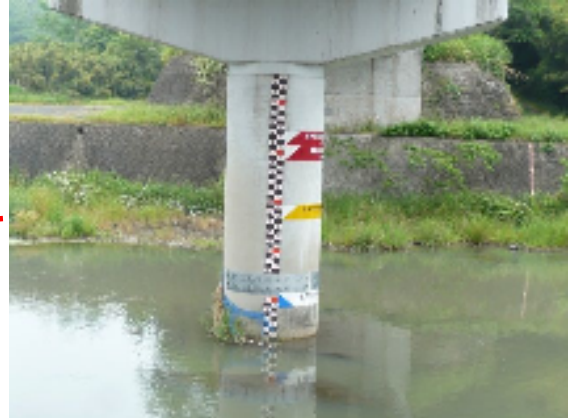
安心院大橋(水位計設置箇所)