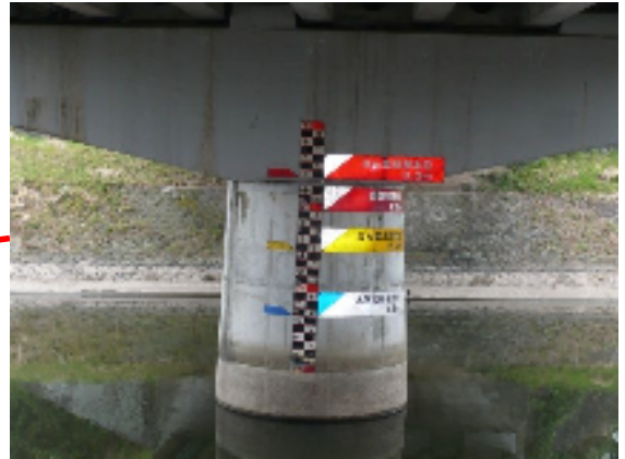
玄川大橋(水位計設置箇所)