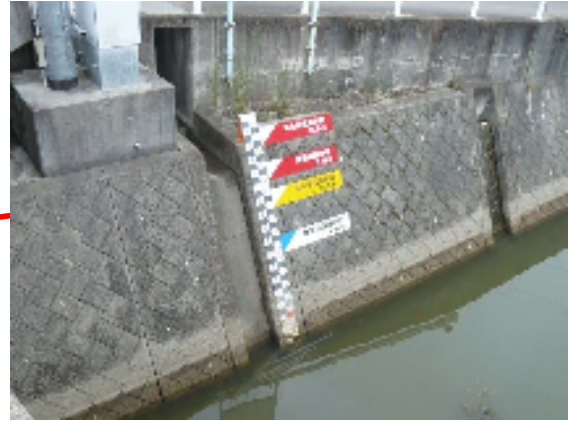
寄藻橋(水位計設置箇所)