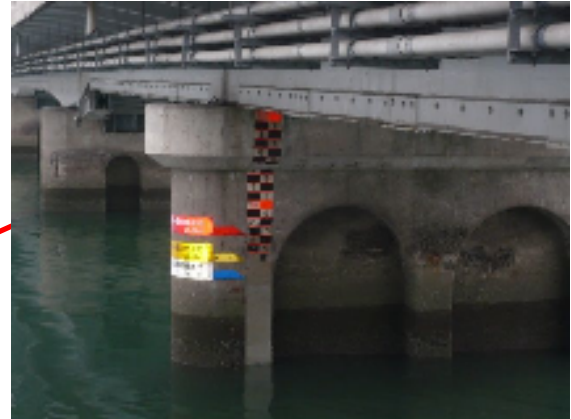
小松橋(水位計設置箇所)