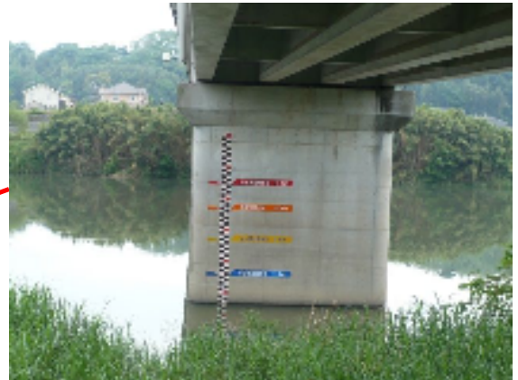
別府橋(水位計設置箇所)