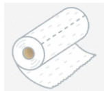
キッチンペーパー