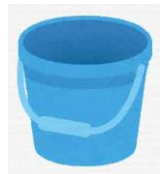
洗ったバケツ (※ 3で作る消毒液を作る場合)