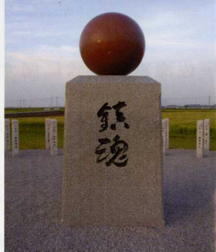
東大寺別当揮毫の記念碑

この道路は、宇佐海軍航空隊の滑走路に重なるように建設されています。太平洋戦争末期に、特攻機がここから南の空に飛び立ちました。この場所は、関係者が帽子をふって見送った場所でもあり、モニュメントが立てられています。