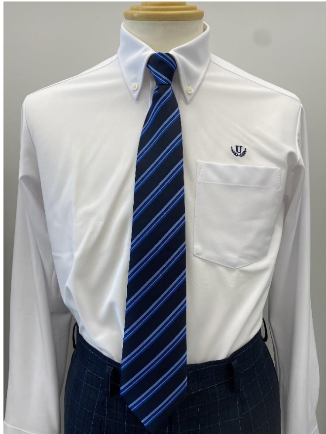
長袖ニットシャツ(ボタンダウン)