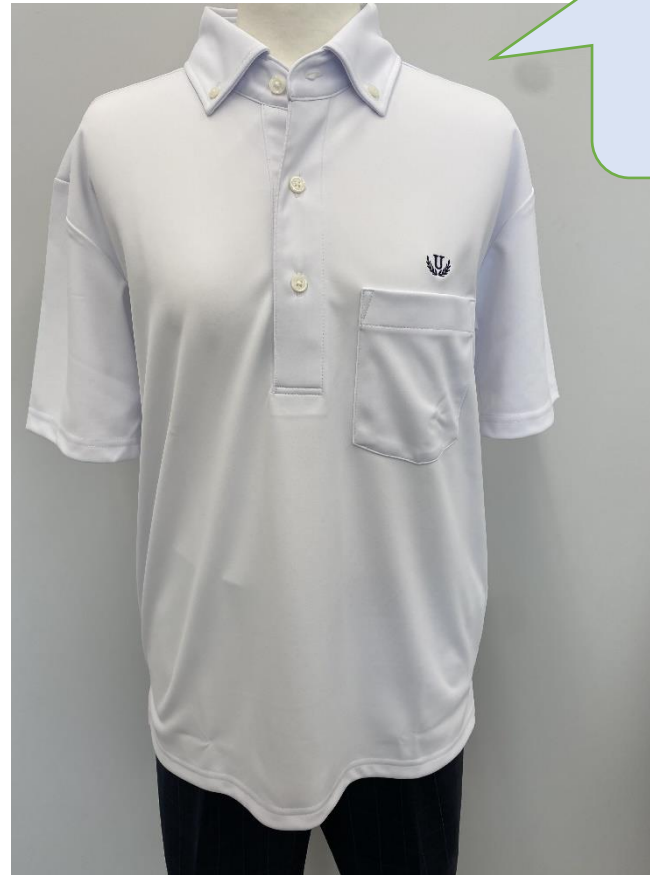
半袖ポロシャツ(長袖ポロシャツも購入可能)