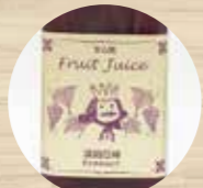
王さまのぶどうジュース

ぶどう作りに真面目に取り組む同園では、有機質肥料のみを使用し樹上完熟させた、自然に近い種入り巨峰「王さまにぶどう」が自社ブランドになっています。