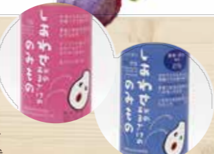
左/しあわせ米のあまざけ 右/しあわせ米のあまざけ (夏季限定青ラベル)

宇佐の米農家の有志が栽培方法の研究を重ね、農薬も肥料も使わず作られた「しあわせ米」を栽培しています。「しあわせ米のあまざけ」は糶にも同米を使い、蔵元が丹精を込めて仕込んでいます。