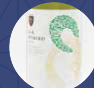
安心院 卑弥呼 白

「農」を通じて、過疎化、後継者減少に悩む地域を活性化しようとして有志が立ち上げた組織です。2010年より宇佐市が認定を受けた「ツーリズムのまち・ハウスワイン特区」の第一号ワイナリーとして、ワイン醸造を開始。年々伸長しているまちおこし組織です。