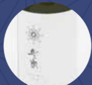
豊潤 白麴 大分三井