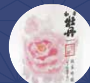
和香牡丹 純米吟醸 ヒノヒカリ50

四ッ谷兼八により大正8年(1919年)に四ッ谷酒造場として創業しました。当時、四ッ谷兼八は魚市場を経営していて、九州各地に商いを広げ、その際各地で口にした焼酎の旨さが忘れられず、自らの手で旨い焼酎造りを目指しました。