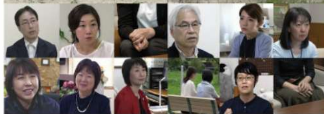
人権学習ドキュメンタリーDVD

家の中での出来事は絶対に外に漏らしてはいけない。 少女は「母を守るために」実父の性的虐待に耐えた。