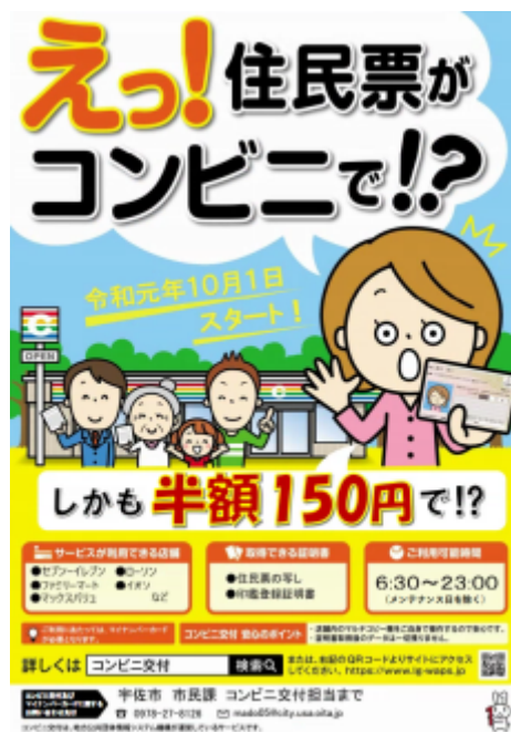
(図 宇佐市コンビニ交付ポスター)