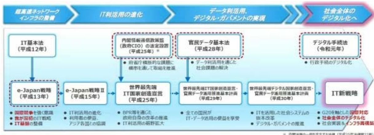
(図 「IT新戦略の概要」令和元年6月 内閣官房IT総合戦略室資料)

そのため、国が掲げるデジタル化三原則（デジタルファースト・ワンスオンリー・コネクテッドワンストップ）への取り組みを強化していく必要があります。