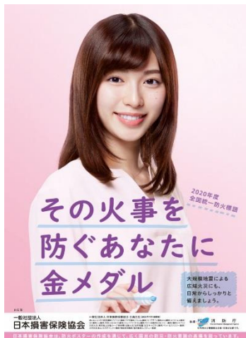
2020年度全国統一防火標語