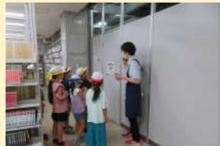
みんなで本を借りた駅館小の子どもたち。

9月4日に駅館小65名、29日に西馬 城小6名の2年生が来館しました。い つも入れない場所にドキドキなが ら、閉架の奥まで見学しました。