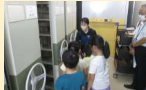
書庫の、しかけ絵本を見る西馬城小 の子どもたち。ご希望にはできるだけ 対応しますので、ご相談ください。