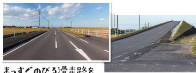
まっすぐのびる滑走路を体感しよう!! 高架を登る角度が、離陸の時の角度と同じらしい!