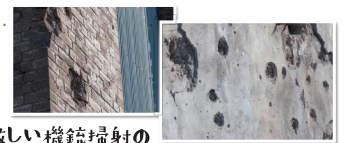
激しい機銃掃射の痕を見ることができます。