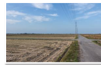
広大な敷地を感じよう!