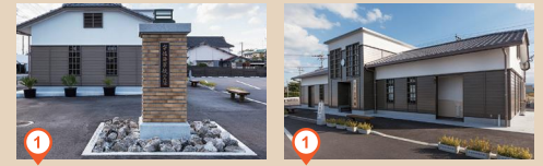
1 宇佐海軍航空隊正門跡

宇佐海軍航空隊は、柳ヶ浦地区を中心として東西1.2km、南北1.3kmの広さがありました。戦後、滑走路をはじめとした航空隊の施設の多くは取り除かれ、水田に戻されましたが、掩体壕や滑走路跡、落下傘整備所などの遺構から宇佐海軍航空隊の広さ、そして空襲の激しさをうかがい知ることができます。