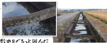
敷地をぐるっと囲んだ水路も当時のまま残っているよ。